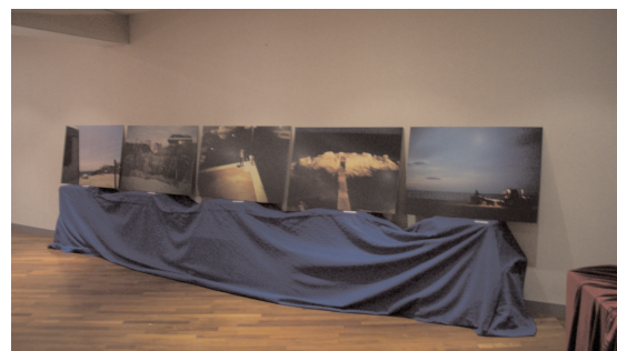
Quelques unes des oeuvres exposées dans le cadre de la 3e Journée technique